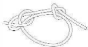
Рисунок 9. Булинь

- для закрепления верёвки к опоре/карабину